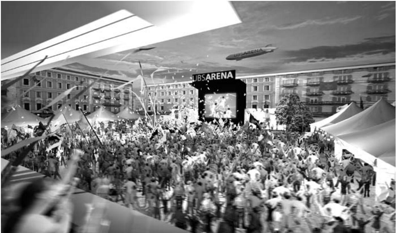
Eine solche Arena soll während der Euro 08 auch in Winterthur eine begeisternde Stadion-Atmosphäre bieten. Auf dem Wachterareal gibt es aber keine so nahen Wohnbauten wie auf obigem Modellbild.

Dieses «Public Viewing» wird anlässlich der Euro 08 ermöglicht durch ein gemeinsames Projekt von Bund und Privaten. Die Projektorganisation Öffentliche Hand Uefa Euro 2008 des Bundes ist Mitinitiantin. Veranstalterin dieses «Public Viewing» ist Perron 8, eine Eventfirma, welche beauftragt ist, die Arenen mit den Grossbildschirmen aufzubauen und zu betreiben (Bild). Als Partnerin agiert die Uefa (europäischer Fussballverband), und Titelsponsorin ist – nebst weiteren Hauptsponsoren – die Grossbank UBS, weshalb auch von UBS-Arenen gesprochen wird.